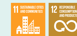
Figur: 10 prinsipper for et bærekraftig reiseliv, Innovasjon Norge.